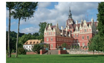
Schloss Bad Muskau

Wechselvoll verlief die Geschichte entlang der beiden Flüsse, prächtige Altstädte und herrschaftliche Parkanlagen erzählen aus längst vergangenen Tagen. Das älteste Zisterzienserinnenkloster Deutschlands, das Barockwunder Brandenburgs, Schlösser und Burgen am Wegesrand ... Im Oderbruch die Dörfer des „Alten Fritz“ – vielerorts sind noch die einstigen Kolonistenhäuser zu finden. Die Vergangenheit der Planstadt