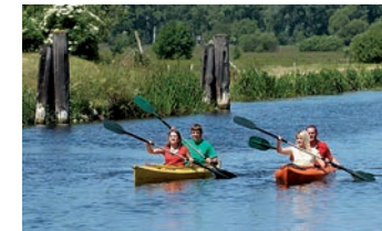
Kanutour im Oderbruch

Im tschechischen Nova Ves entspringt die Neiße. Munter plätschert sie vom Isergebirge durch ein waldreiches, ursprüngliches Tal dem Zittauer Becken entgegen. Weiter flussabwärts laden Wildwasserabschnitte zu Kanu- oder Raftingtouren ein.