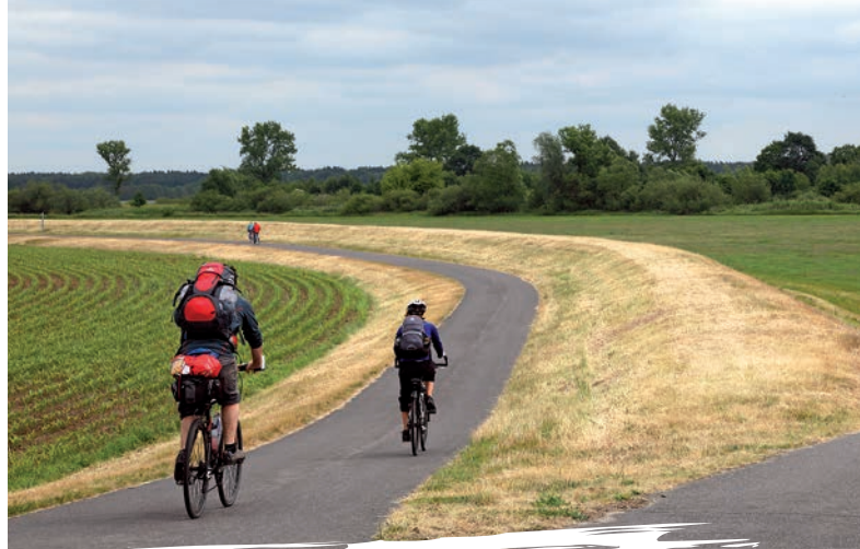
Radfahrer auf dem Oder-Neiße-Radweg bei Ratzdorf

Am Alten Bollwerk 9, 17373 Ueckermünde Tel. (03 97 71) 284-84, -85, www.urlaub-am-stettiner-haff.de