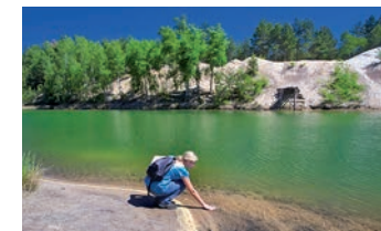
Geopark Muskauer Faltbogen

Die fruchtbare Ebene des Zittauer Beckens, das ursprüngliche Neißetal, die endlosen Wiesen des Oderbruchs, die Hügellandschaft der Uckermark und die Haffküste ... vielfältig sind Flora und Fauna vom Gebirge bis zur Ostsee. Wo Adler